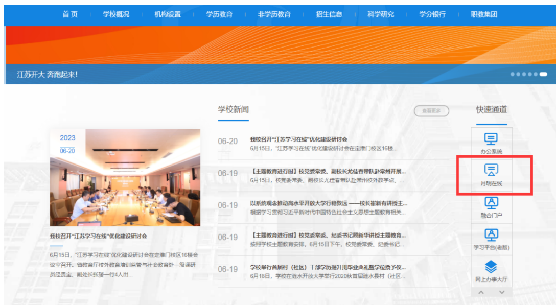
图 1-1 学校首页

打开江苏开放大学官网首页，点击右侧“月明在线”如图 1-1，或打开浏览器，输入网址： http://xuexi.jsou.cn/jxpt-web/index ，进入登录页面，如图 1-2。